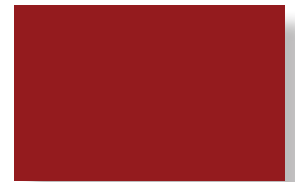
Demie page 194 mm X 124,5 mm

Fournir les encarts publicitaires en format JPEG, TIFF, EPS ou PDF en 300 dpi.