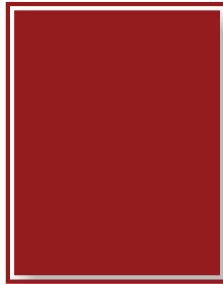
Page entière 210 mm X 273 mm + 5mm de fond perdu